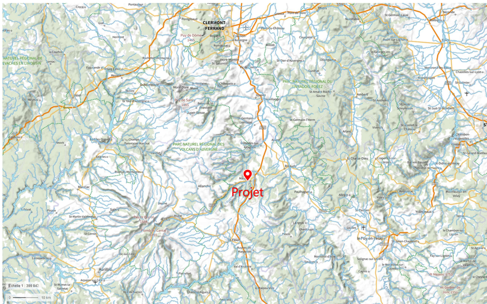
Plan 1 – Localisation projet

CENTRALE HYDROELECTRIQUE DU MOULIN GRAND